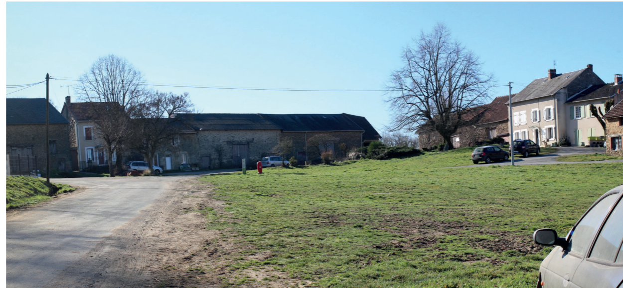
Photographie de l'état simulé