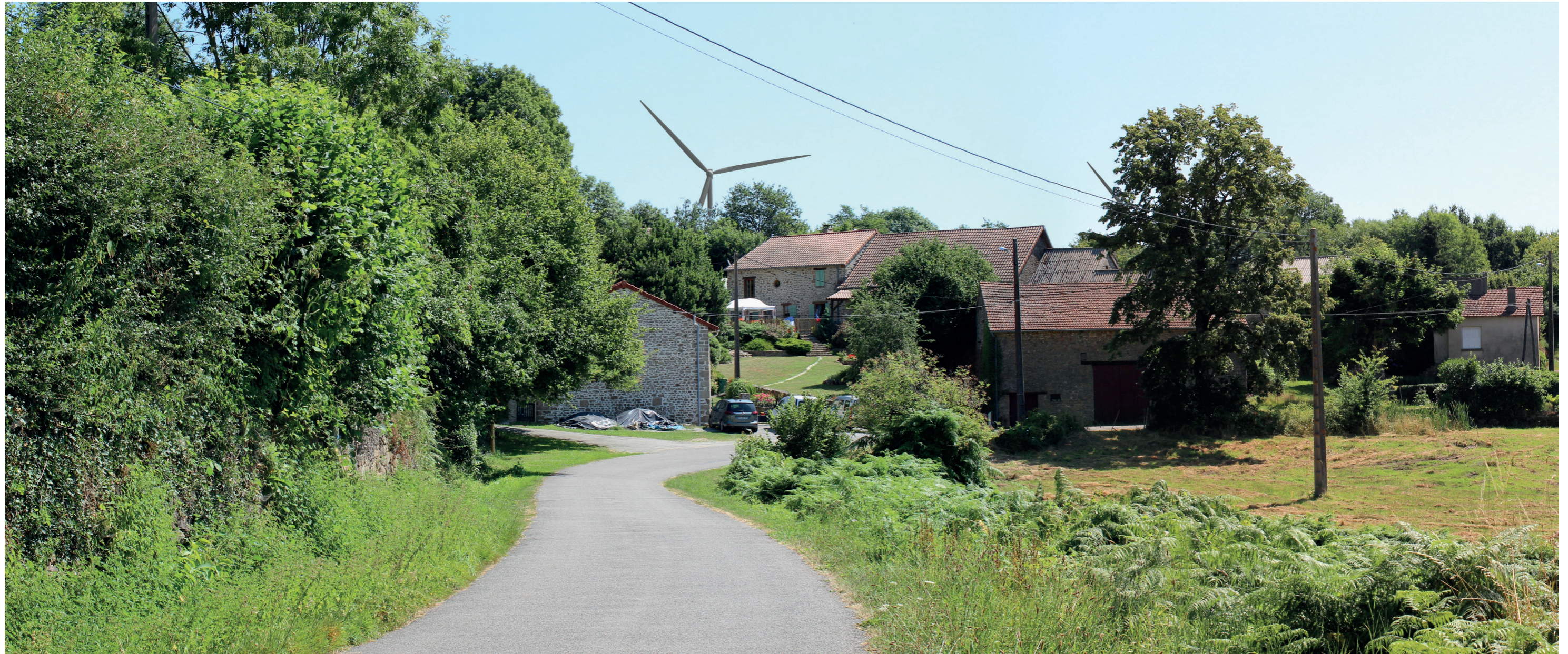
Photomontage à 50° L'observateur doit s'éloigner de 42 cm pour une observation réaliste sur une impression A3.

Commentaire : Le contexte très végétalisé du hameau ainsi que le relief limitent fortement les vues depuis les habitations. Néanmoins, des échappées visuelles sur le projet éolien sont possibles depuis la route qui traverse le hameau. On aperçoit ici E2 et E3, les autres éoliennes étant masquées par le relief et la végétation. Bien que partiellement masquées par la végétation, les éoliennes paraissent imposantes. E2 apparaît en arrière-plan des habitations, qu'elle domine largement.