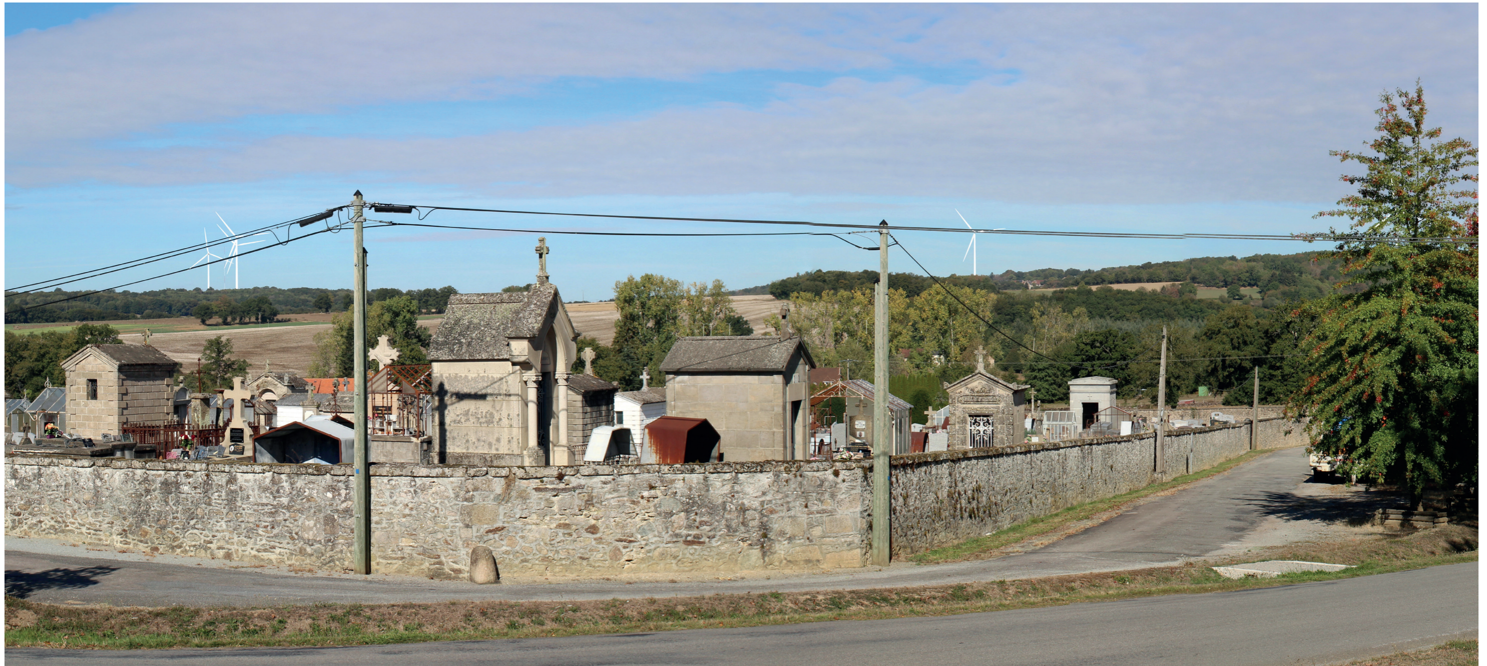
Photomontage à 50° L'observateur doit s'éloigner de 42 cm pour une observation réaliste sur une impression A3.

Commentaire : Au niveau du cimetière, la vue est dégagée en direction du projet éolien. Ce dernier apparaît sur le versant opposé de la vallée de la Gartempe. Les trois éoliennes sur la gauche apparaissent très regroupées. Deux se superposent, ce qui peut perturber la lisibilité de l'implantation. Les deux éoliennes sur la droite apparaissent très à l'écart, elles-mêmes très écartées entre elles. L'une est ici presque entièrement masquée par un arbre mais serait visible en se décalant sur la gauche, ainsi qu'en hiver, lorsqu'il n'y a pas de feuillage. L'implantation présente un caractère dissymétrique mais est bien lisible. Les rapports d'échelle sont équilibrés, le relief accueillant les éoliennes paraissant environ deux fois plus élevé que la hauteur des éoliennes. Il n'y a par conséquent pas d'effet de dominance ou de surplomb.