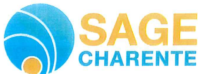
Schéma d'Aménagement et de Gestion des Eaux du bassin versant de la CHARENTE