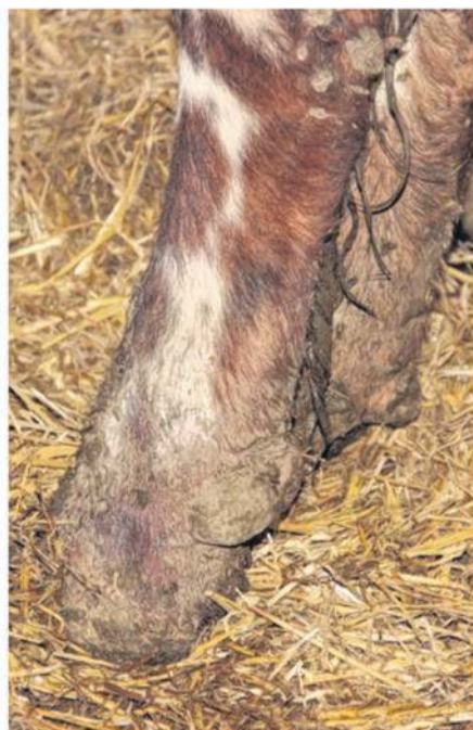
À gauche : De nombreuses vaches, extrêmement stressées, refusent de quitter leurs logettes pour passer au robot de traite. À droite : Chez beaucoup aussi, l'éleveur constate « des pattes anormalement gonflées ».