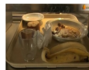
compostage déchets cantine